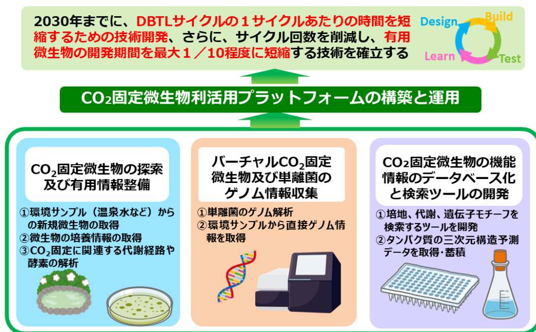
図1 「CO 2 固定微生物利活用プラットフォームの構築」の概要

今般、NITE は、NEDO 及びコンソーシアム参加 7 機関の協力を得て、CO 2 からのバイオものづくりを志す企業とコンソーシアムが早期から緊密に連携するための新たな共同体「グリーンイノベーションフォーラム(GI フォーラム)」(図2)を立ち上げます。