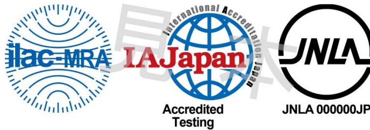
図1 ILAC MRA 組み合わせ認定シンボル

備考:ILAC MRA マークは ILAC により国際商標登録されている。(国際登録番号:840857)