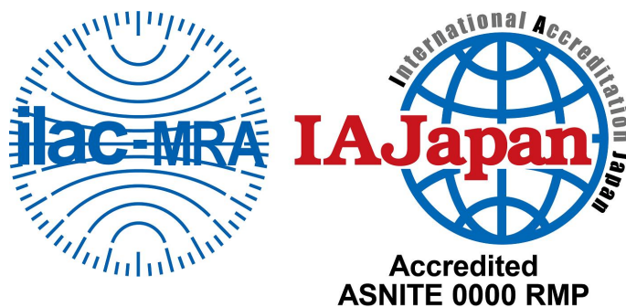
図1 ASNITE 標準物質生産者認定シンボル

認定事業者がその認定の地位を示すことに用いるために、IAJapanによって交付されるシンボル。認定機関ロゴに、認定識別を加えた一体のもので構成される。認定シンボルは認定事業者が発行するRM文書(“標準物質認証書”又は“製品情報シート”)に使用することができる(下図1参照)。