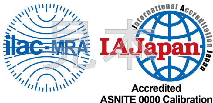
図1 認定事業者が使用できる認定シンボル